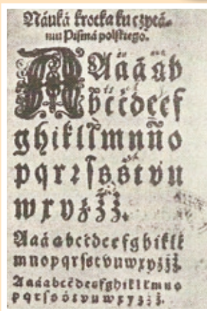
Najstarsze abecadło polskie, z XVI w.

W Polsce posługujemy się nieco zmodyfikowanym alfabetem łacińskim.