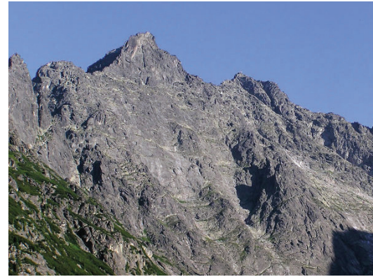
Tatrzańskie Rysy (2499 m n.p.m.) – najwyższy szczyt Polski.

Całą północną i środkową część Polski zajmują niziny. Są to płaskie lub lekko pofałdowane tereny wznoszące się do wysokości około 200 m n.p.m. Do nizin zaliczają się też nieco bardziej pofałdowane pojezierza, gdzie wysokości przekraczają 300 m n.p.m. Na południowym wschodzie rozciąga się pas wyżyn o wysokościach 200–500 m n.p.m. Natomiast wzdłuż południowych granic kraju występują góry, których wysokości przekraczają 500 m n.p.m.