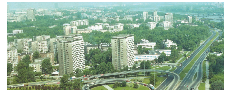
Duże miasta, np. Warszawa, rozwinęły się głównie na nizinach.