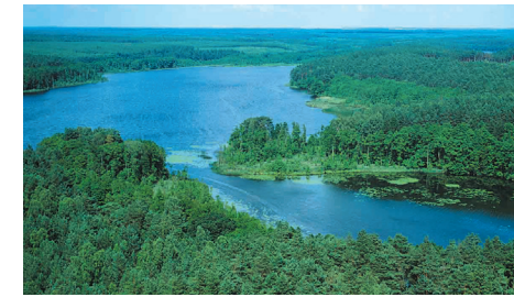
Jeziora i lasy – typowy krajobraz pojezierzy.