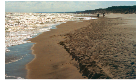
Piaszczysta plaża nad Morzem Bałtyckim.

Ponad połowę obszaru Polski pokrywają użytki rolne – pola uprawne, łąki, pastwiska, sady. Lasy występują głównie na pojezierzach i w górach.