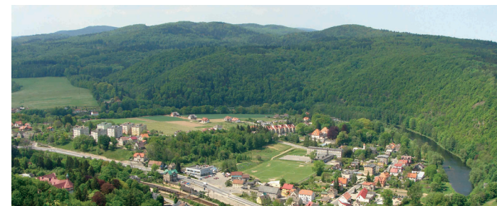
Wyżyny i góry pokrywają lasy i użytki rolne, wśród których leżą małe miejscowości.