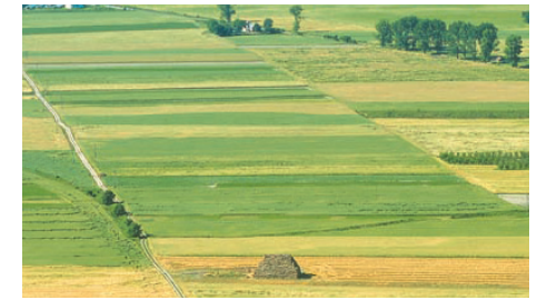
Na nizinach dominują tereny rolnicze.