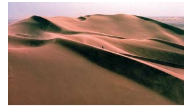
Sahara – największa pustynia świata.

Wielką Kotlinę Konga porastają gęste, wilgotne lasy równikowe. Zarówno na północ, jak i na południe od nich występują te same strefy roślinności – najpierw są to sawanny, potem pustynie i półpustynie, a na wybrzeżach roślinność śródziemnomorska. Ludność zamieszkuje głównie w sawannach oraz nad brzegami mórz, jezior i wielkich rzek, gdzie zajmuje się rolnictwem.