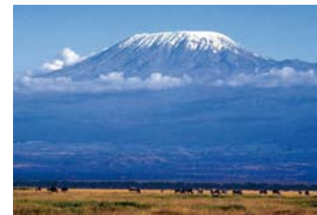
Wygasty wulkan Kilimandżaro – najwyższa góra Afryki.