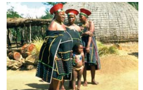
Ludność z plemienia Zulusów.