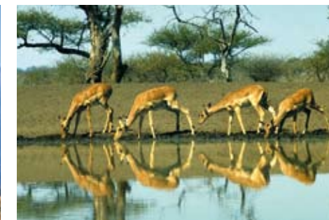
Antylopy u wodopoju podczas pory suchej w sawannie.